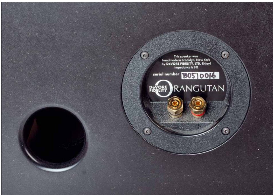
Der relativ kleine Bassreflexaustritt ist natürlich perfekt auf die O/Baby abgestimmt. Viel hilft nicht unbedingt viel