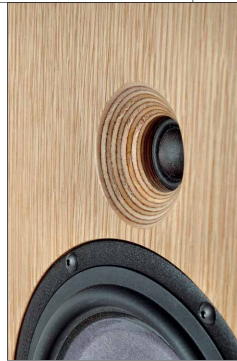
Hier erkennt man sehr schön, wie der Waveguide für den fantastischen Hochtöner in die Multiplex-Frontplatte eingefräst wurde

Zuerst wurde es ein Würfel, ähnlich dem für die Mitarbeiterin, aber größer. Mit etwa 30cm Kantenlänge im geschlossenen Gehäuse und dem gleichen Treiber mit 20cm Durchmesser war das nicht schlecht, aber auch nicht das, was er suchte. Zudem passte der Kubus nicht in das angepeilte Schallplattenregal wegen der hinten überstehenden Kabelanschlüsse. Also ging die Entwicklung weiter. Seas machte ihm jede Menge kleinere Versionen der O/96 und O/93 Woofer mit und ohne Dustcap, mit oder ohne Schwirrkonus, bis er sich schließlich eine Version von knapp 18cm Durchmesser mit Papiermembran, steifer Papierdustcap und Phaseplug wie bei den größeren Modellen entschied. Das war genau, wonach er gesucht hatte. Papier ist übrigens für DeVores Ohren schlicht das beste Membranmaterial für seine Tiefmitteltöner. Es verbindet die gewünschte Steifheit und sehr gute Dämpfungseigenschaften mit geringem Gewicht. Dazu kommt die breite Gummisicke für einen ausgedehnten Bass. Dem Materialübergang vom Papier hin zum Gummi schenkt er dabei besondere Aufmerksamkeit.