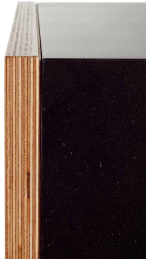
Hier sieht man sehr schön den Materialübergang vom MDF-Korpus zur Multiplex-Schallwand. Look und Klang bilden eine Synergie